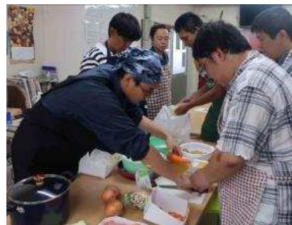
料理男子 テッパン! カレーライス