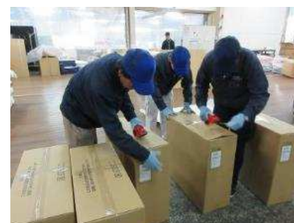
布団の梱包・出荷作業