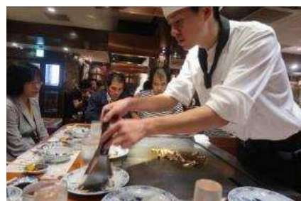
超美味 神戸牛の高級ステーキ!!