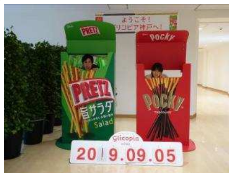
グリコピアにて ポーズ♡