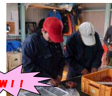
トマトのバック詰めを始めました。