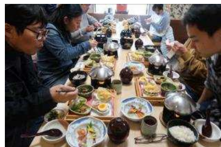
お疲れ様♪のお食事会