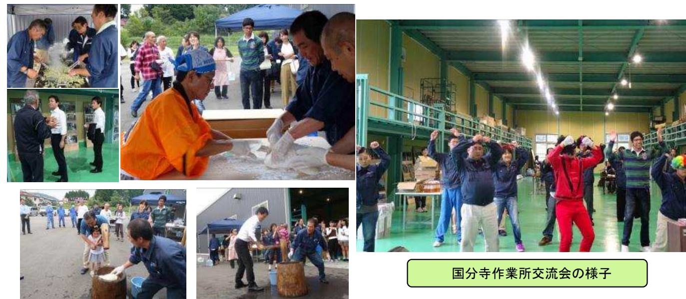
国分寺作業所交流会の様子