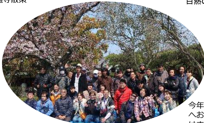
今年も栗林公園へお花見に出かけました。