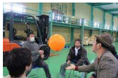
白熱の風船バレー