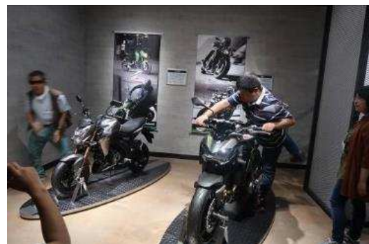
カワサキワールドでバイク試乗