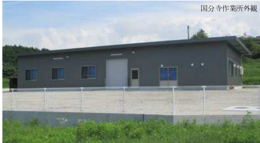
国分寺作業所外観