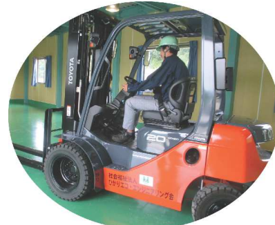
社会福祉法人丸紅基金の助成金でフォークリフトを購入しました。