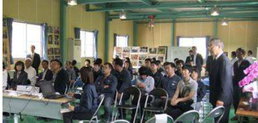
施設の概要を説明しました。