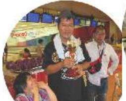
白熱のボウリング大会