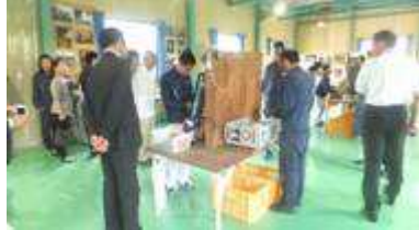
作業の様子を見て頂きました。

式当日は、多くのご来賓の方々にお越しいただきました。また、式後に利用者さんが実際に作業している姿や、ひかりエコの紹介写真を見ていただきました。